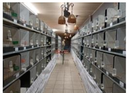
Internationale TT 2022 tijdens de beurs