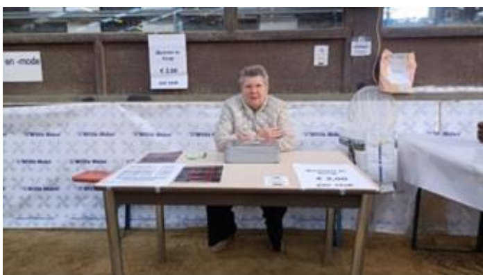
Petra de financiële dame van EKVV