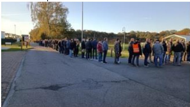
Top drukte in Venlo