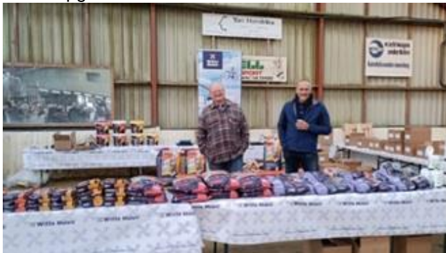
Stand hoofdsponsor Witte Molen