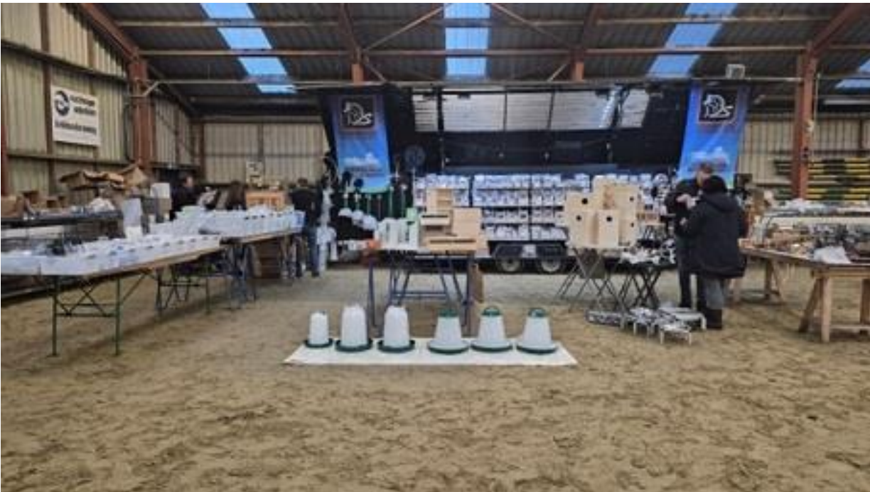
Prachtige stand Dierenservice