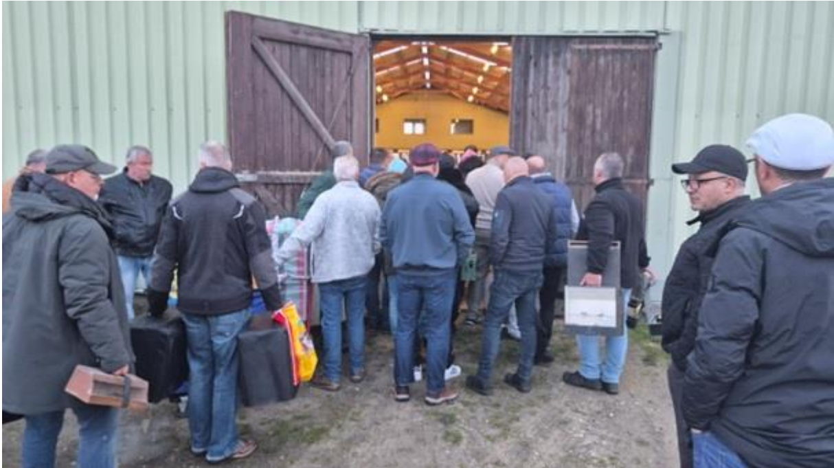
Iedereen wacht rustig op zijn beurt.