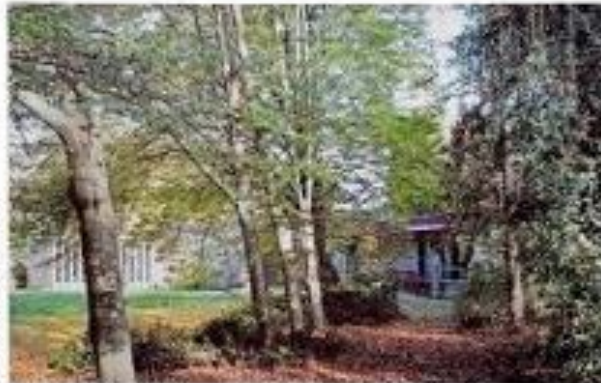
Het klooster van de zusters Dominicaans, gelegen in het groen.

Het vertrek van de zusters Dominicaans, die sinds januari 2018 in Venlo woonden en werkten, kwam te een oorzakenstelling door het overlijden van twee zusters in het begin van dit jaar. Aanvankelijk waren ze gepland om in een complex dat op site bouwde van de zusters in Venlo over te nemen. De Dominicaans hadden het gebouw verhuurd in 2006 en gepland het als wooncomplex voor hun zusters van College Albertshof. Gevoegdelijk was het een lichte, breedbevoegd gebouw. De zusters konden er in twee etages wonen.